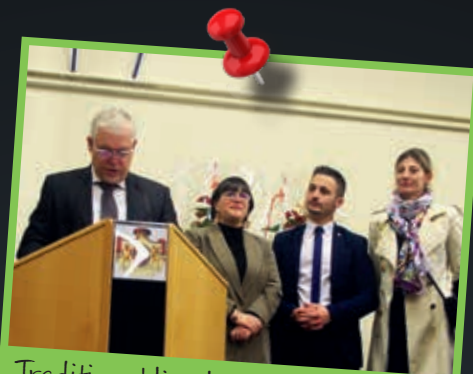
Tradition oblige, la mairie de Fitz-James ouvre le bal des vœux dans le Clermontois...

Pendant trente ans, avec l'aide de sa compagne, Godin se consacre entièrement à sa mission réformatrice. Godin meurt en 1888. Il laisse un patrimoine bâti exceptionnel, plusieurs ouvrages sur la question sociale et, surtout, l'exemple d'une organisation profondément réformatrice.