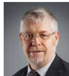
Jean-Claude Pellerin Maire de Fitz-James