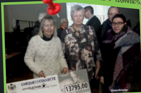
Cette année encore, notre collecte atteint un chiffre impressionnant : 13 795 € remis à l'AFM Téléthon !