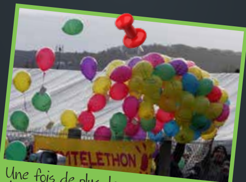
Une fois de plus, les organisateurs du Téléthon de Fitz-James ont su attirer les habitants et leurs familles.