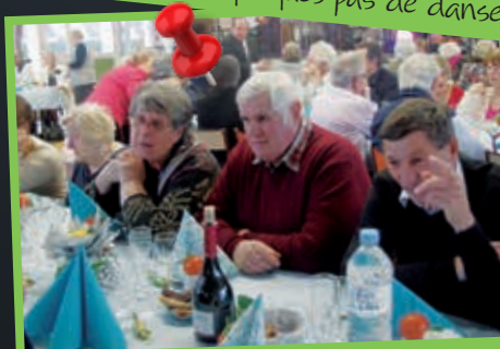
Une fort belle décoration de table, tout en bleu et orange, qui invite à passer un bon moment ensemble !