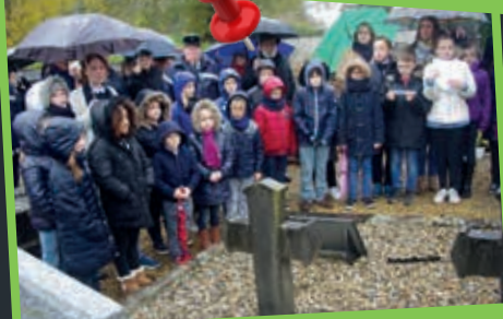
Les élèves de la Béronnelle rendent hommage aux victimes des combats de la Première Guerre mondiale.