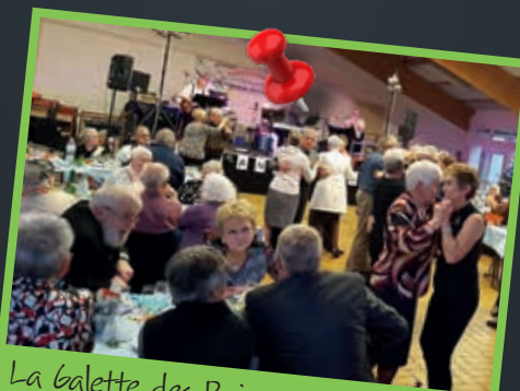
La Galette des Rois : une bonne occasion de se retrouver, de papoter et d'esquisser quelques pas de danse.