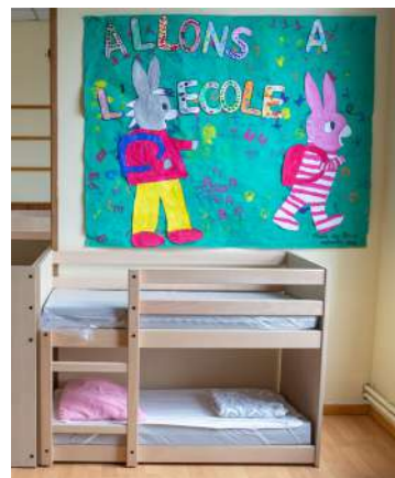
Des lits de 73 cm pour être aux normes et faciliter l'accès aux petites jambes des enfants.

La réorganisation des écoles aura été le travail de l'été pour offrir aux enfants une belle rentrée.