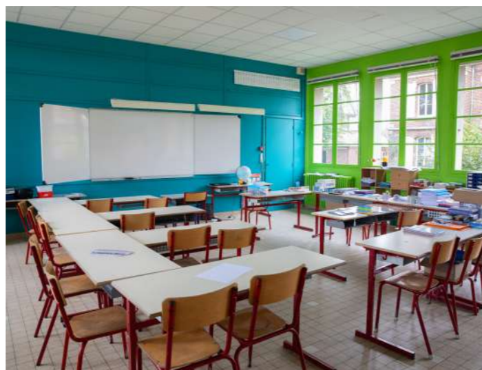
Les peintures des classes de CM1 et CM2 de l'école de la Béronnelle ont été refaites cet été pour égayer l'environnement éducatif des enfants

Fitz-James compte aujourd'hui 10 classes réparties sur 2 sites. Un CM1 et un CM2 à la Béronnelle, 4 primaires (CP, CE1, CE1/CE2, CP/CE2) et 4 maternelles à l'école de la Tuilerie. Les plus petits sont désormais dans un environnement plus calme et ont découvert 14 nouveaux lits superposés pour de bonnes siestes.