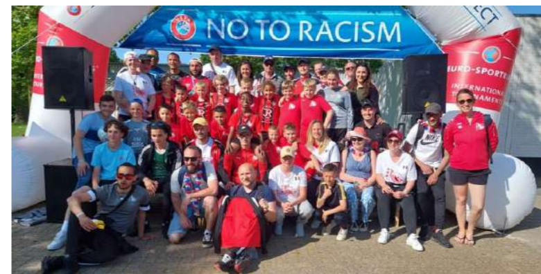
La commune de Fitz-James était très fière d'avoir participé à hauteur de 1 500 euros au voyage en Hollande organisé la saison dernière dans le cadre d'un tournoi international. 117 personnes (jeunes, parents, bénévoles et encadrants) ont pu se rendre à Arnhem pour défendre leur club. Les 60 jeunes joueurs ont pu revenir très fiers avec un beau classement de 2 fois 2 e , 1 fois 3 e . Un joli palmarès au regard des équipes adverses, danoises, hollandaises, anglaises, allemandes, belges. Il y avait de la concurrence !

Et pour continuer à jouer collectif, les 2 terrains à 8 vont être prêtés aux rugbyman le temps des travaux de leurs installations. Ils pourront ainsi poursuivre leurs entraînements dans de bonnes conditions.